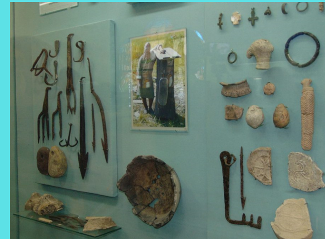
Археологічні знахідки під час розкопок Вишгородського городища

Наукова новизна та теоретичне значення дослідження полягає в тому, що вперше цілісно проаналізовано становлення й розвиток літописних міст Чернігівщини та Київщини впродовж кінця XI – початку XIII ст., у роботі конкретизовано передумови розвитку міст Сосниці, Хоробор та Вишгород, особливості їх функціонування, окреслено шляхи актуалізації виявленого досвіду в умовах сучасної школи (активізація роботи класних керівників на прикладах історії рідного краю, удосконалення навчально-виховного процесу).